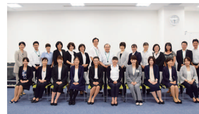
女性キャリアアップセミナー参加者

2018年度は、次長クラス以上の女性の「他社交流会」を実施予定です。他社の方から良い刺激を受け、より女性が活躍できる風土となるようみんなで一緒に力を合わせ目標達成に向けての取組みを進めます。